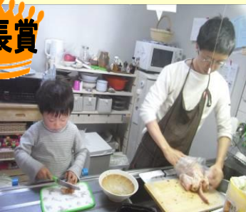
「今夜は鶏の丸焼き」