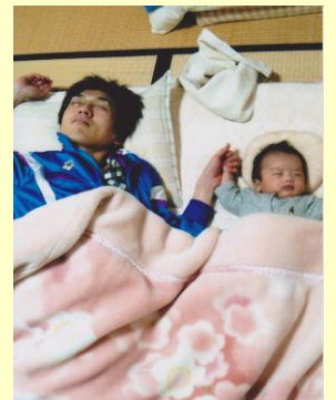
「オレ流、寝かしつけ」