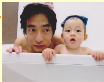
「今日もボクが一番風呂！」