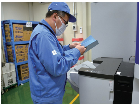
水を一切使わず古紙を再生紙にしています

製作所内では、安全、交通、環境の3部会があり、月1回の会議では活発な意見が飛び交うそうです。「社員の声を聞くということは地域のお声を聞くことでもあり、地域のニーズに応えるこの活動が社員の質を高め、会社の成長に繋がると信じています」と長江所長は語ってくれました。