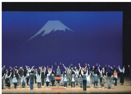
裾野市民芸術祭にて