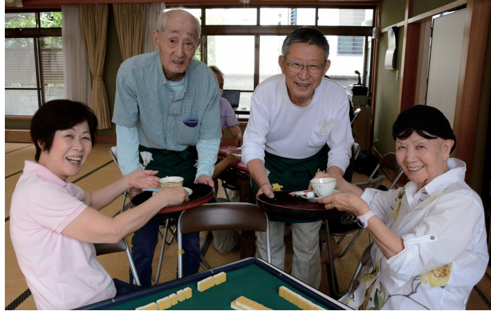
麻雀を楽しむ女性にコーヒーを提供する遊友会のメンバー

383世帯を有する平松の自治組織。昭和38年の三菱レイノルズアルミニウム（株）・富士製作所（現、MAアルミニウム（株））開所を契機に人口が増加。当時、7世帯・35人だった世帯は、約50倍に増加し、発展している。自治会組織は、自治会長・区長・協議委員会（協議委員で構成）・役員会（組長・自主防災会長など各種団体役員で構成）を設置し、機能を使い分けている。