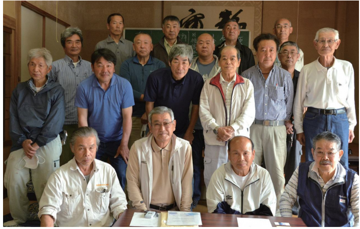
葛山城址保存会役員の皆さん