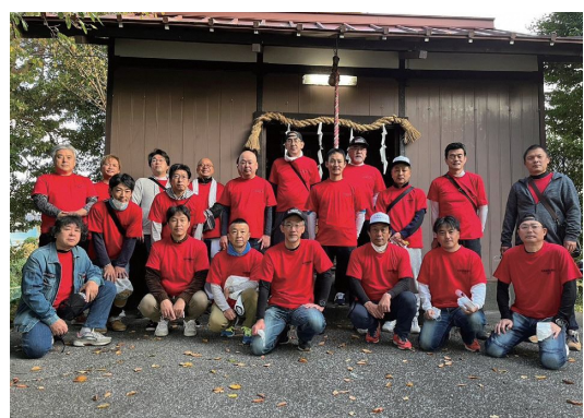
お揃いの「赤T」がひかる地域振興委員会のメンバー