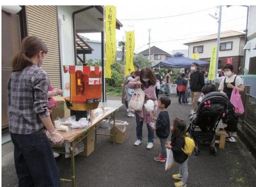
区民が楽しむコミュニティ祭り