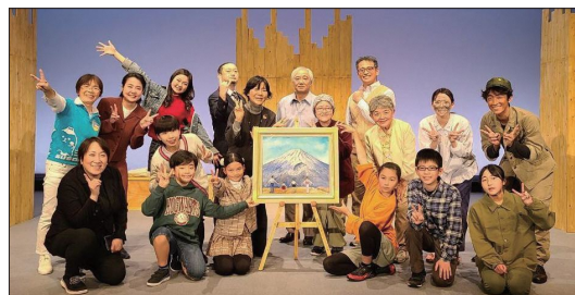
昨年度の出演者たち