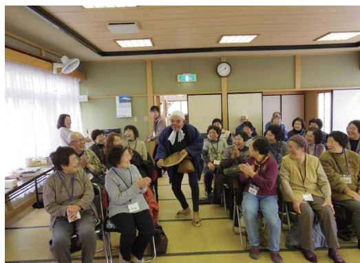
芸達者な区民が披露する一芸（茶話会より）