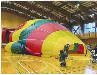
空気を入れたら、体育館いっぱい!