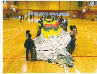
みんなで広げるよ!