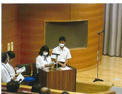
わたしの主張 裾野市大会