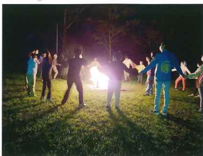
最強のキャンプファイヤー!