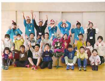
みんなで、ハイポーズ！