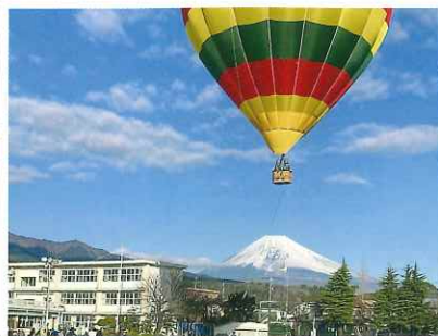
西小で熱気球に乗って大空へ