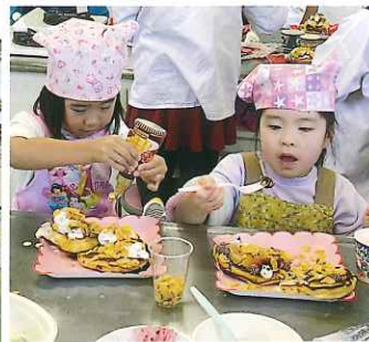
デコレーションしたら、みんなでいただきます！