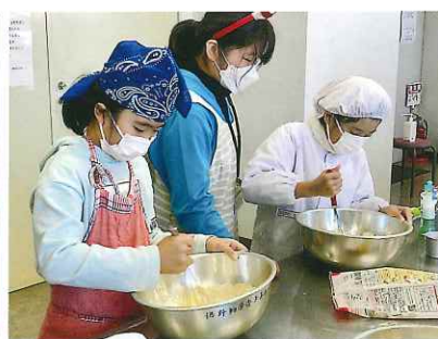
パンケーキづくり!めっちゃうま!