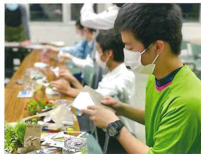
オリジナルのジオラマ作り!