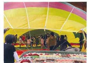
バルーンの中は、 とても不思議でキレイな世界!