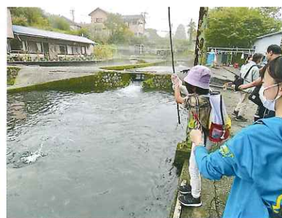
釣ったマスを焼いて食べたよ