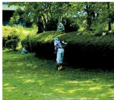
【小柄沢公園：参加者9名】