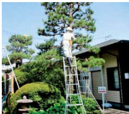
【中央公園：参加者32名】