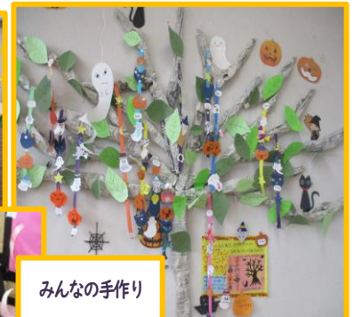
みんなの手作り ハロウィン