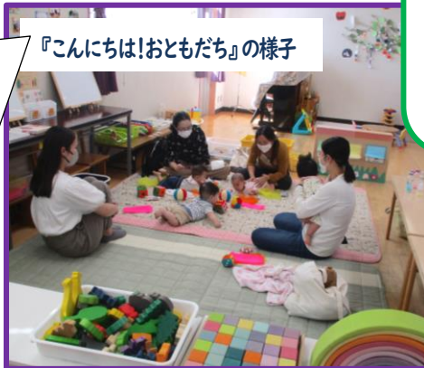
『こんにちは!おともだち』の様子

わらべうた遊びの後は ママさん同士で楽しく おしゃべり♪笑い声に 赤ちゃんも安心したの かスヤスヤねんね…。 穏やかな時間が嬉しく 感じられました。