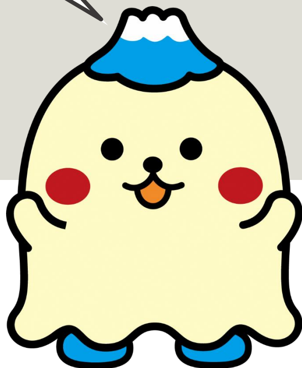
裾野市マスコットキャラクター すそのん