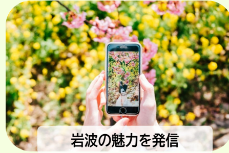
岩波の魅力を発信