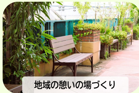
地域の憩いの場づくり