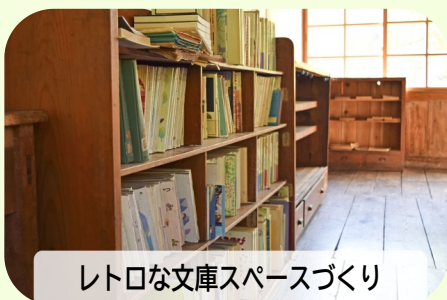
レトロな文庫スペースづくり