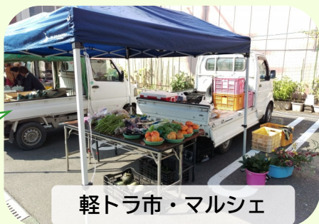
軽トラ市・マルシェ