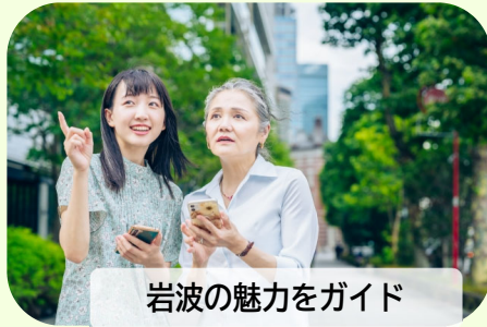
岩波の魅力ガイド