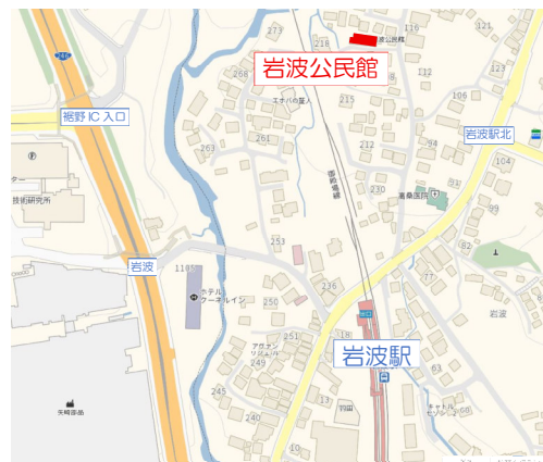
岩波公民館 位置図