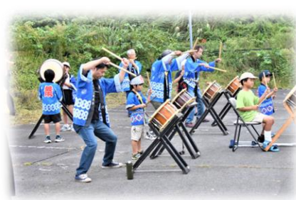
岩波区お囃子保存会の演奏