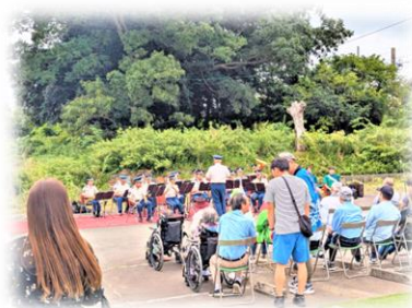
静岡県警察音楽隊の演奏

また、消防・警察・福祉などの働く車の展示、乗車体験や模擬訓練などさまざまな催しが行われ、子どもから大人まで幅広い世代でにぎわいました。