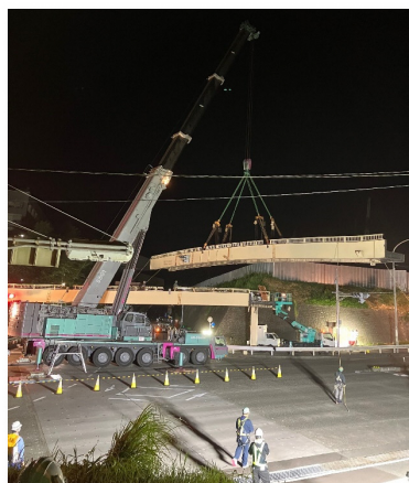
御宿第一歩道橋の撤去作業の様子