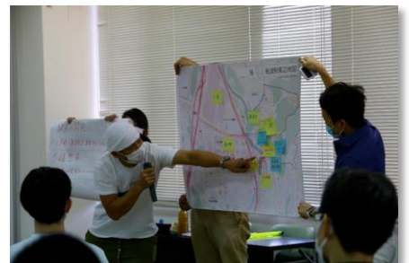
▲大切にしたいこと実現したいことを発表