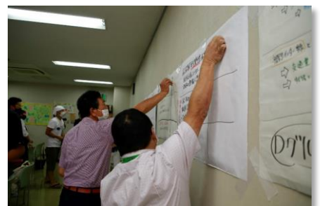
▲共感した取組や理由に投票

大切にしたいこと、ぜひ実現したいことを各グループで3つ選んで発表し、参加者間で投票を行いました。