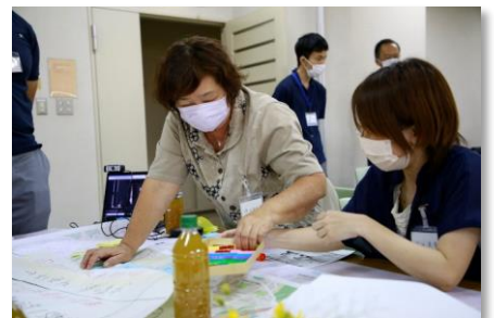
▲グループワークの様子