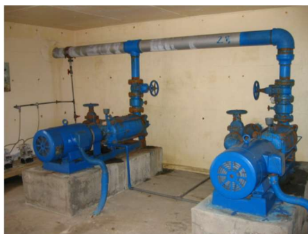
第5水源揚水場（汲み上げた地下水は浄水後、ご利用のお客様のご家庭へ送られます）

深さ200～300mの深井戸を水源としており、年間を通して、水質・水量ともに安定しており、恵まれた好ましい環境にあります。