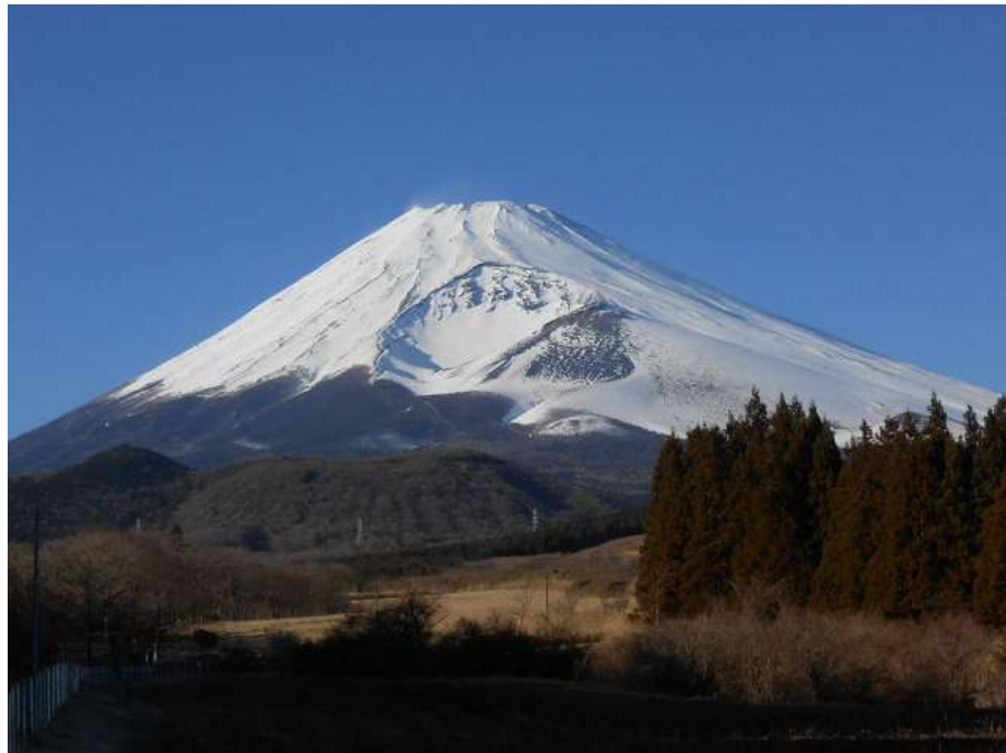
十里木高原からの富士山

このたび、ご利用の皆様安心して水道をお使いいただけるよう、水質検査の内容や検査体制をより一層充実させた「水質検査計画」を策定いたしました。