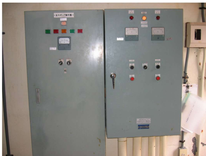
第5水源揚水場（取水から配水まで一連の工程を自動運転で行っています）

水源は、恵まれた好ましい環境にありますが、地下水はいったん汚染されると、浄化されるまでに非常に長い年月を要しますので、自然環境の保護等十分に配慮していきます。