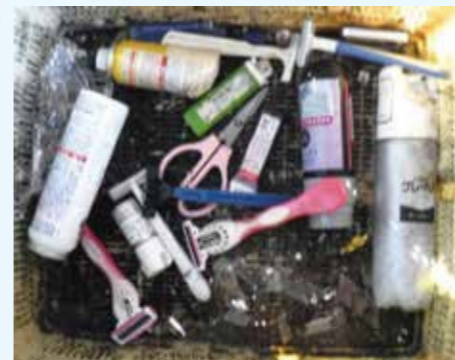
危険物(スプレー缶・刃物等)