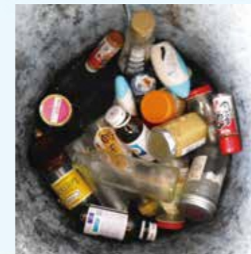
ガラス製品、ピン等