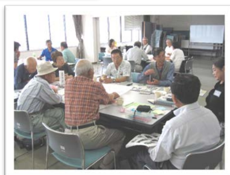
話し合った後に、要点を付箋紙に記入する方式を試しました