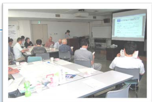
写真を交えて重点プロジェクト(案)を説明しました