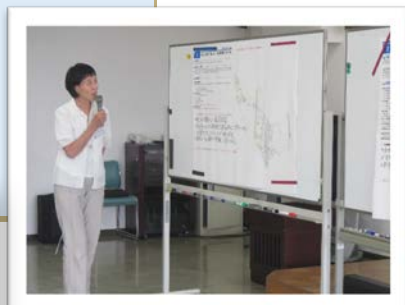
グループ発表で検討結果をみんなで共有します