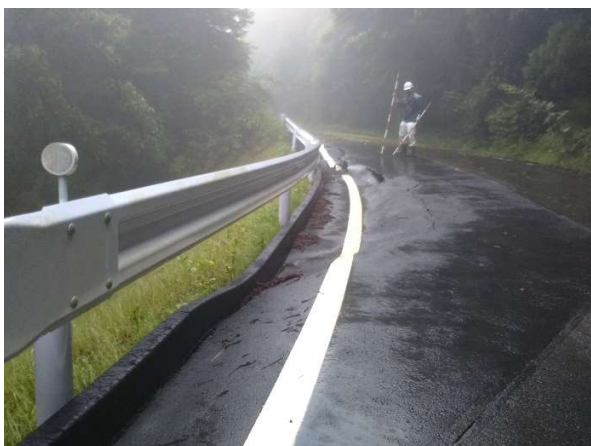
広域基幹林道北箱根線① 路肩陥没