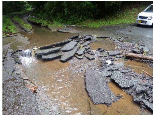
市道 2080 号線・美化センター一進入路 (大畑地内)