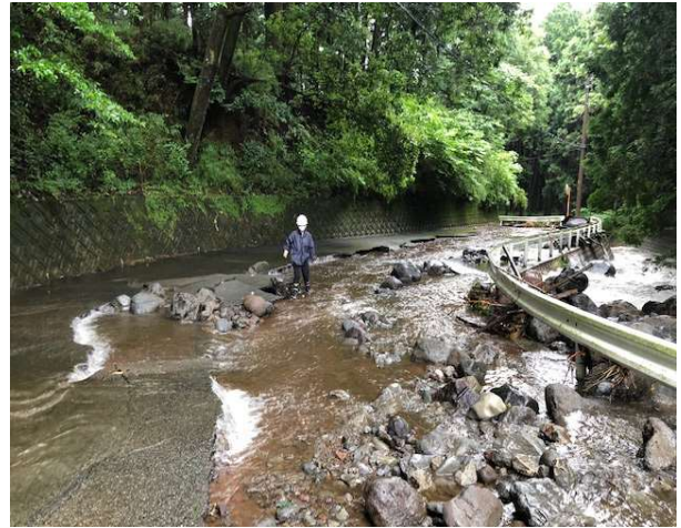
市道 2154 号線 (千福地内)