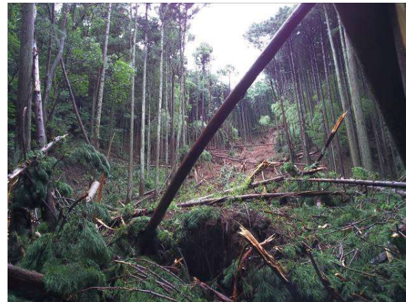
久根の林道付近 地すべり