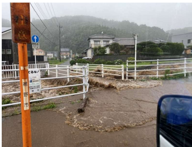
入田川 市道 1425 号線（茶畑地内）