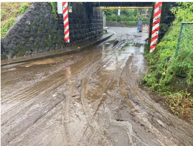
深良地内 (切久保ガード)