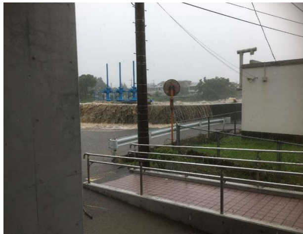
黄瀬川 佐野堰（生涯学習センター）