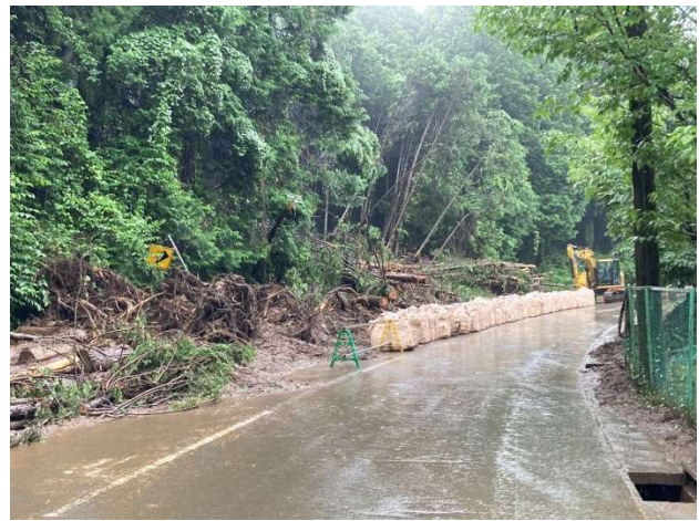
県道仙石原新田線（豊後橋付近）