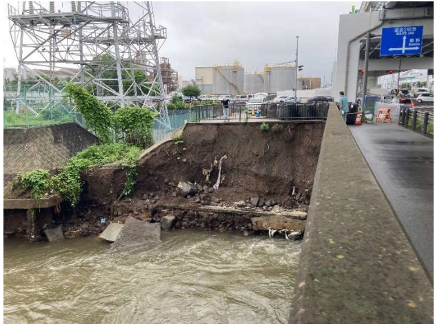
大場川（伊豆島田地内）