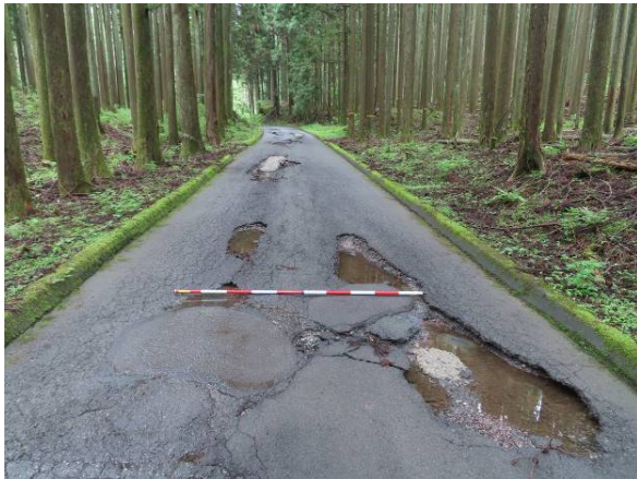
林道大沢入線 路面洗堀