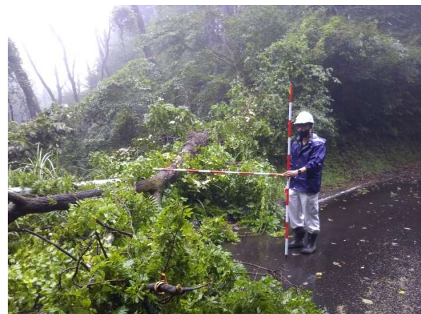
広域基幹林道北箱根線② 倒木