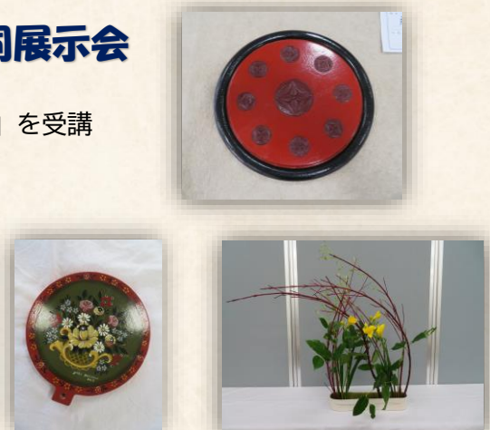
(写真は以前の作品です)