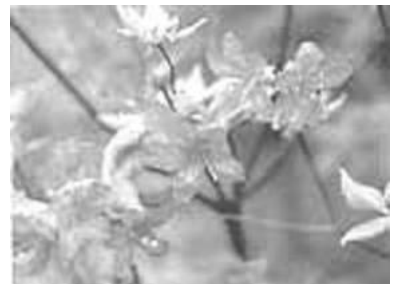
市の花 アシタカツツジ

愛鷹山や天子岳の標高 800m～1,500m の辺りに自生する珍しいツツジ。5月下旬から6月にかけて、紅紫色の花を開かせる。市の文化財にも指定されている落葉低木である。