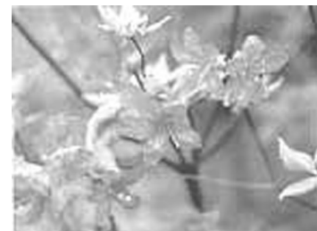
市の花 アシタカツツジ

愛鷹山や天子岳の標高 800m~1,500mの辺りに自生する珍しいツツジ。5月下旬から6月にかけて、紅紫色の花を開かせる。市の文化財にも指定されている落葉低木である。