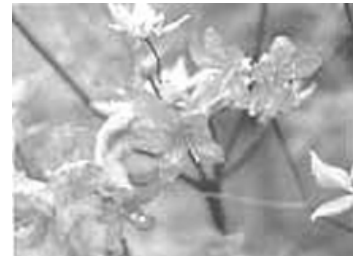
市の花 アシタカツツジ

愛鷹山や天子岳の標高 800m~1,500m の辺りに自生する珍しいツツジ。5月下旬から6月にかけて、紅紫色の花を開かせる。市の文化財にも指定されている落葉低木である。