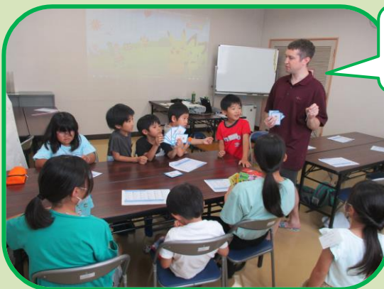
スコット先生と英語で遊ぼう