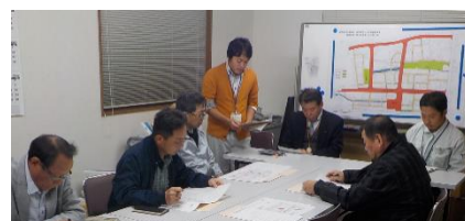
第2回区長連絡会の様子