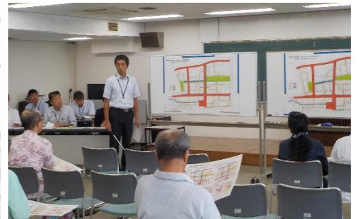
都市計画変更に関する説明会の様子

設計図は平成25年3月の説明会からお示ししているものから大きな変更はございません。