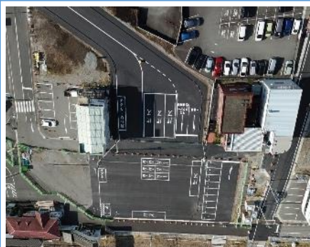
現在の臨時駅前広場を令和元年12月に供用開始しました。