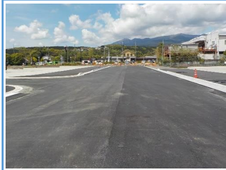
桃園平松線の一部築造、隣接する街区の宅地造成を行いました。当路線は令和2年度、平松新道線に接続して一部供用を開始します。