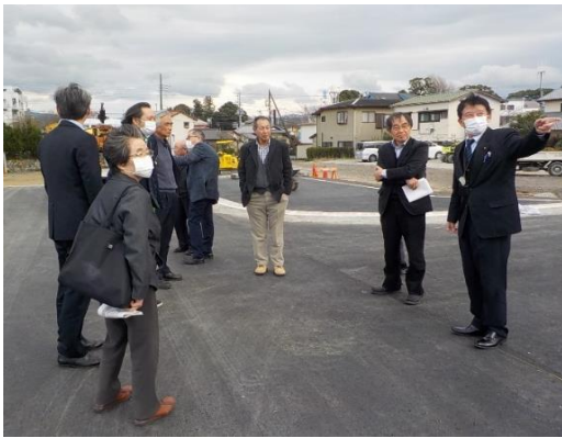
桃園平松線周辺部工事の状況を視察