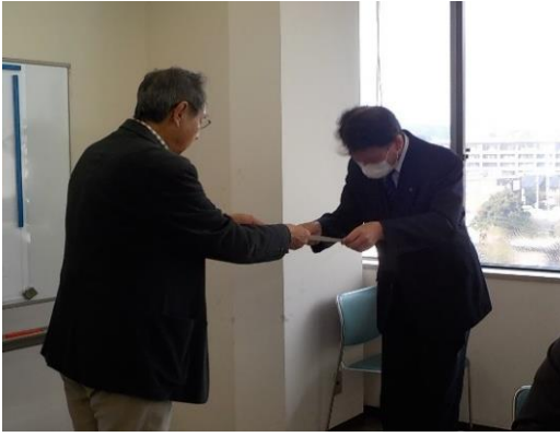
市から審議会に諮問

令和2年3月19日(木)に、第44回裾野駅西土地区画整理審議会を開催しました。今回は、第20回仮換地指定について審議が行われ、原案のとおり指定して差し支えないとの答申を受けました。今後、仮換地指定通知を対象地権者へ送付させていただきます。