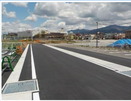
6M-3号線、6M-4号線(写真)、6M-13号線の築造、ならびに隣接する街区の宅地造成を行いました。