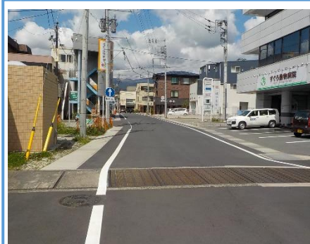
裾野踏切から平松新道線までの8M-8号線を供用開始しました。

裾野駅西口周辺部では、引き続き駅前広場を中心に駅の利便性の向上に向けた工事を行いました。