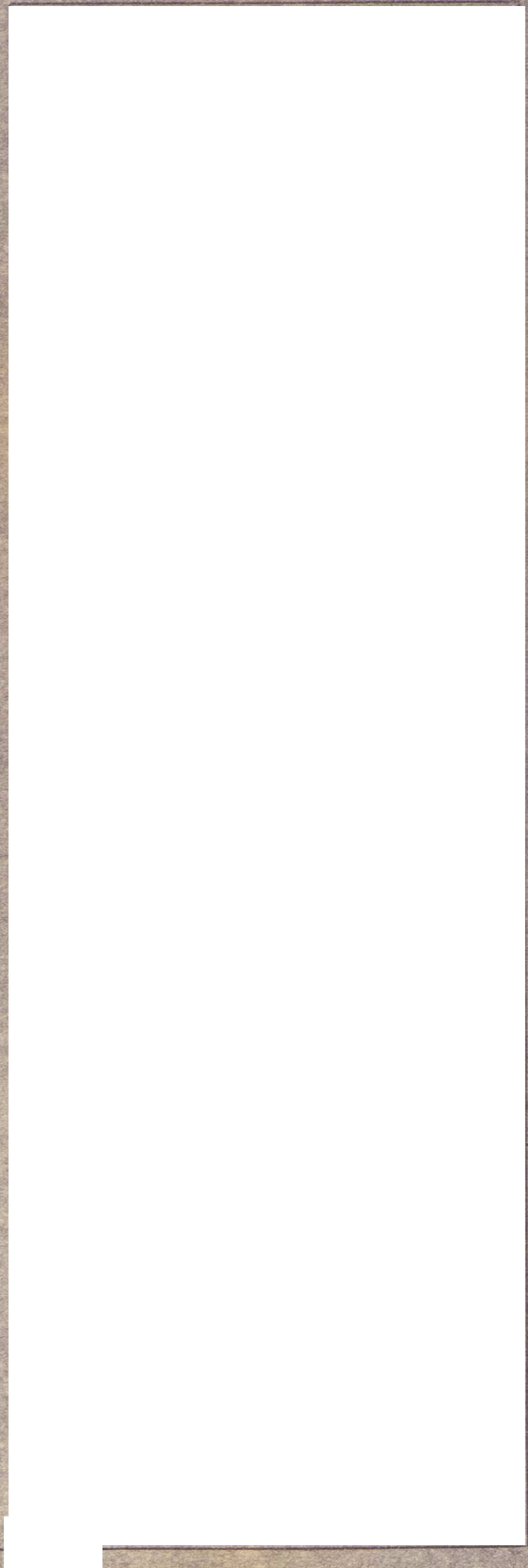
地籍図 (本測図及び公図等) S1:300