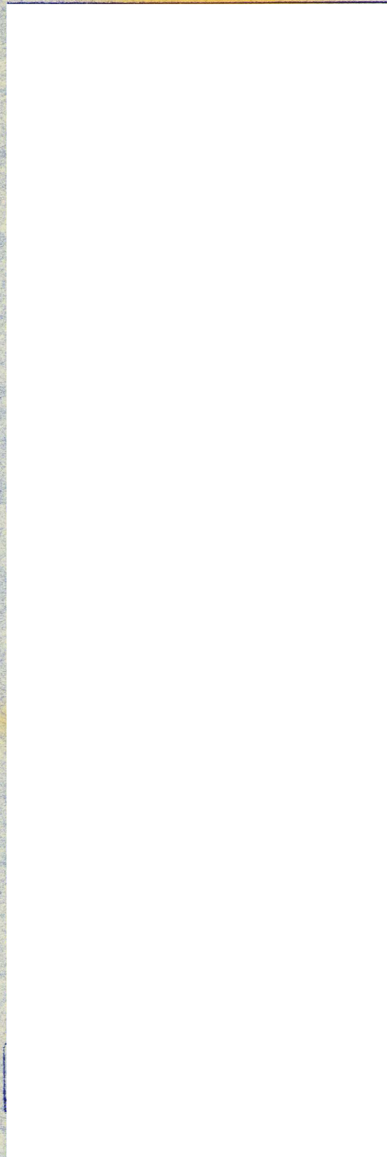
地籍図 (実測図及び公図写)