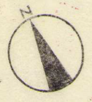
地籍図 (実測図及び公図写)