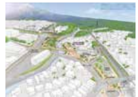
JR岩波駅周辺整備のイメージ

答 立地適正化計画の改訂を先送りにする分、630万円の国費を事業に充当することとした。