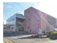
東西公民館がある鈴木図書館

答 公民館は継続していく。東西公民館事業、図書館事業、教育支援センター事業、学びの森事業が効果的に共存できるよう現在検討している。