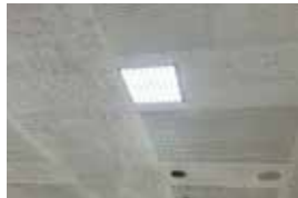
LED化した庁舎の照明