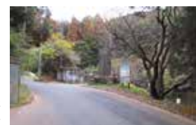
県道仙石原新田線 深良用水穴口付近

答 観光交流人口の拡大を目指すためにも、駐車場の整備は県道の拡幅と合わせて検討すべきと考えます。県や地元の皆様と連携しながら、駐車場のより良い整備方法を研究して行きたい。