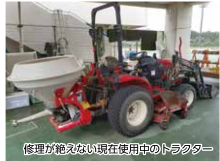
修理が絶えない現在使用中のトラクター

答 購入は1台で、芝刈り機能、肥料散布、 めっち 目土を行うもの。本体は500万円、その他の部品が300万円。