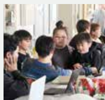
地元小学生も熟演