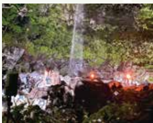
ドラマ 「ペンディングトレイン」