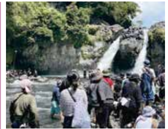
映画 「世界の終わりから」