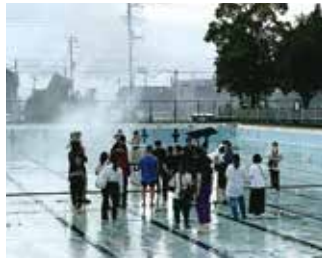
MV (ミュージックビデオ) BiSH 「SEE YOU」