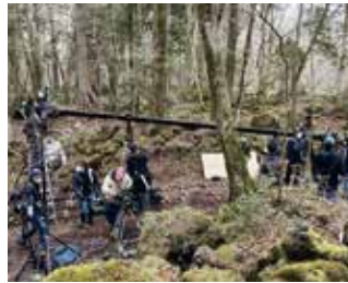
MV (ミュージックビデオ) Vaundy 「走馬灯」