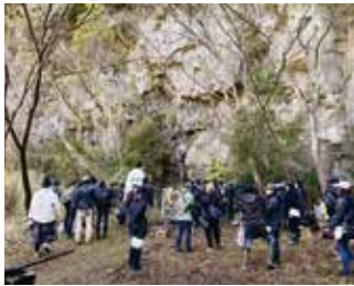
大河ドラマ 「鎌倉殿の13人」