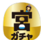
富士宮の魅力 いっぱい限定 ガチャ