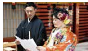
▲須走浅間神社での神前式の様子

社務所には資料館が併設し、神社所有の宝物や史料類などが展示され、富士山登山道須走口の歴史を知ることができます。入館料無料ですので、須走浅間神社を訪れた際には、合わせてご覧ください。