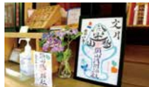
▲須山浅間神社の御朱印