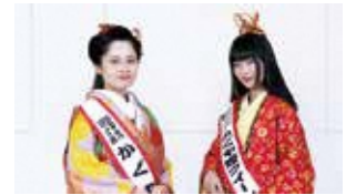
▲富士市観光PR大使 第37代 かぐや姫クイーン(右)とかぐや姫