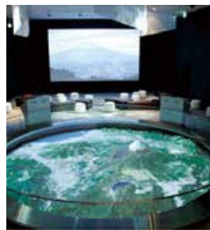
▲富士山樹空の森 「天空シアター」