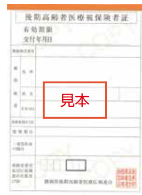
10月1日(土)から 令和5年7月31日(月)まで