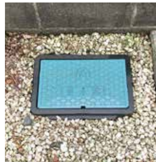
水道メーターボックス