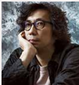
映画監督 行定 勲さん

長い期間、オープンセットを建てさせてくれたおかげで、リアリティーある世界観が作れたと感謝しております。