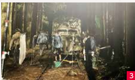
1. 今里山林 2. 五竜の滝(雌滝) 3. 忠ちゃん牧場周辺