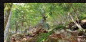
▲中央の石碑が光親卿の墓