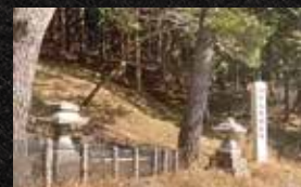
▲藤原光親卿の墓への入口