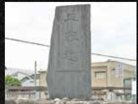
▲平家越の石碑(今泉)

水鳥が飛び立った音に驚いた平家軍が敗走した場所である 「平家越」と平家方が物見（見張り）をした「物見堂」、頼朝が 鎧を脱いで体を洗ったとされる鎧ヶ淵親水公園、13人のうち の1人である和田義盛にちなんだ地名や神社など市内にはゆかり の地が数多くあります。市内各所を巡り、富士川の合戦に思 いを馳せてみませんか。