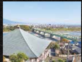
▲物見堂(岩淵)は、市内が 一望できる絶景スポット