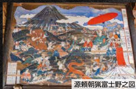
源頼朝狩富士野之図

源頼朝が現在の御殿場市周辺の富士山麓で行った大規模な巻狩は、富士の巻狩と呼ばれています。源頼朝が朝廷から征夷大將軍に任ぜられ、名実ともに鎌倉に幕府が開かれたのは、建久3（1192）年。その翌年、富士の巻狩が行われました。市内には、富士の巻狩やその時代にまつわる旧跡や伝承が数多くあり、富士の巻狩と関係があるとされる地名も数多く残っています。