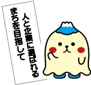
裾野市マスコットキャラクター