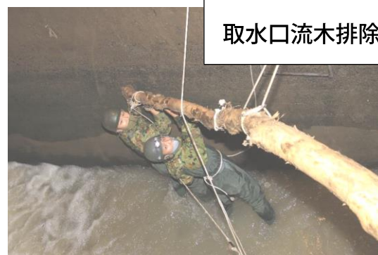
取水口流木排除作業