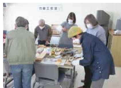
▶ 竹細工教室 ◀