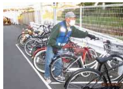
▶ 自転車整理作業 ◀