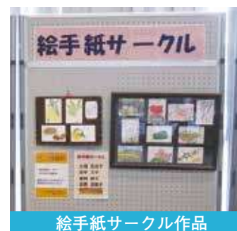
絵手紙サークル作品