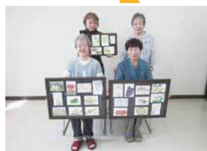
▶ 絵手紙サークル ◀