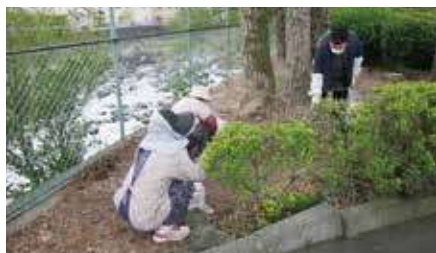
【中央公園：参加者33名】

4月22日(火)に、会員の社会貢献の意識向上とシルバー人材センター事業の普及啓発活動の一環として、奉仕作業を行いました。中央公園・小柄沢公園・偕楽園を対象に、68名が分散参加し、日頃の業務で培った技術を生かし、剪定や草刈りと草取りに汗を流しました。ご参加いただきました会員の皆様、お疲れさまでした。