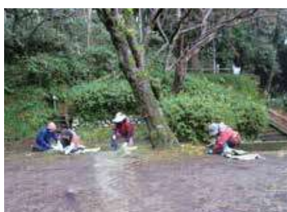
▶ 公共施設奉仕作業(草取り) ◀