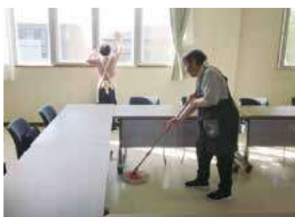
▶ シルバーワークプラザ清掃作業 ◀