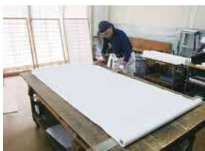
▶ 障子張替え作業 ◀