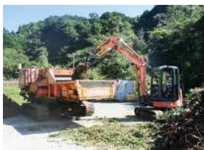
▶ 枝葉処理作業 ◀