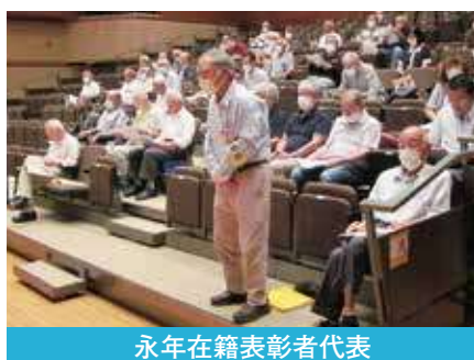
永年在籍表彰者代表