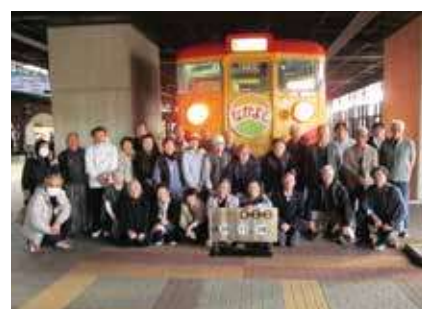
▶ 会員親睦研修旅行 ◀