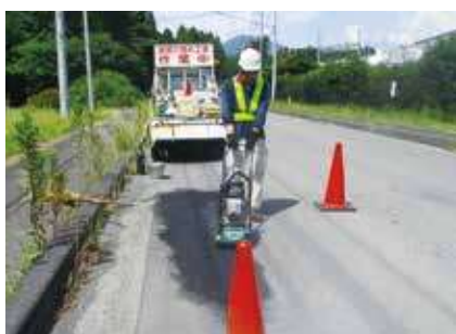
▶ 道路舗装補修作業 ◀