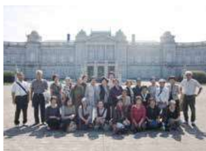
▶ 女性会員視察研修 ◀