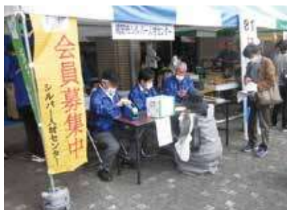
▶ 包丁研ぎ(フェスタすその) ◀