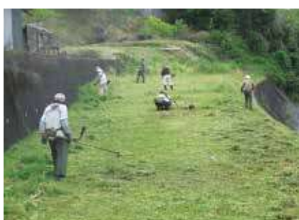
▶ 公共施設奉仕作業(草刈り) ◀