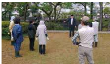
【小柄沢公園：参加者11名】