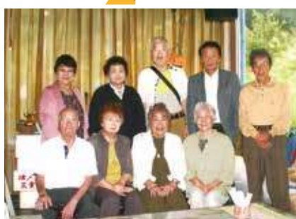
▶ カラオケ同好会 ◀