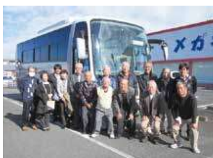
▶ 役員視察研修 ◀