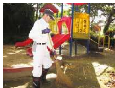
▶ 公園清掃作業 ◀