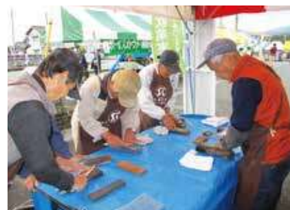
▶ 包丁研ぎ(ふれあい広場) ◀