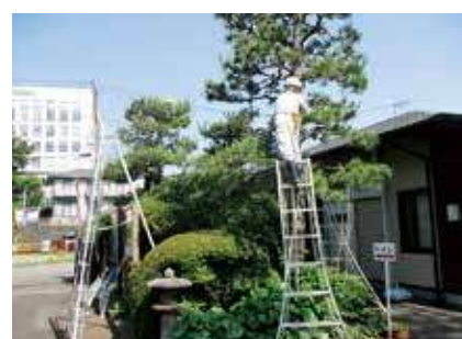
▶ 公共施設奉仕作業(剪定) ◀