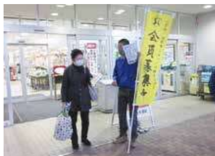
▶ 普及啓発活動 ◀