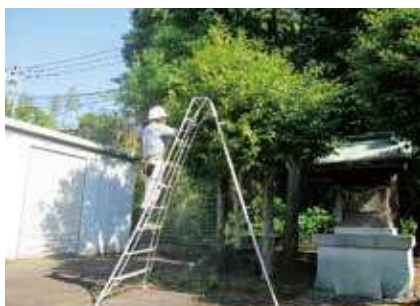
▶ 剪定作業 ◀