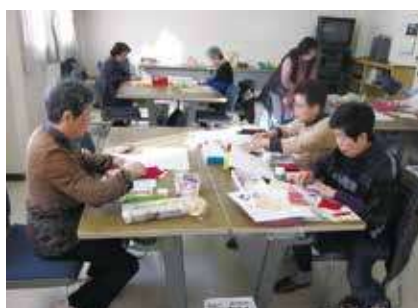
▶ 手芸講習会 ◀