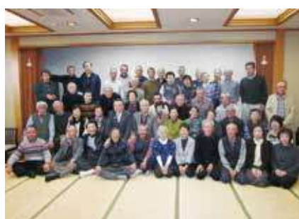
▶ 忘年懇親会 ◀