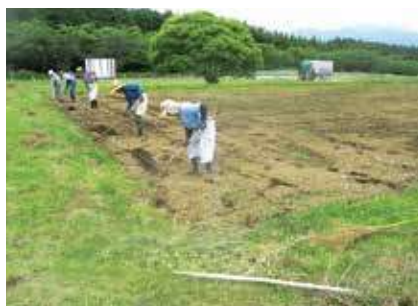
▶ コスモス種まき作業 ◀