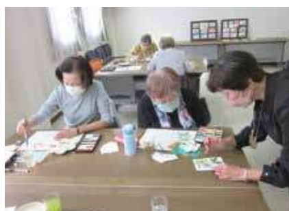
▶ 絵手紙教室 ◀