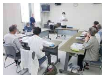
▶ スマホ講座 ◀