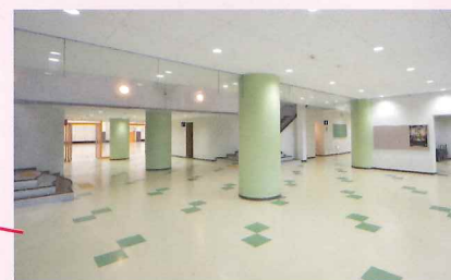
エントランスホール (Entrance Hall)

(Judo Hall) ■Arena/183.90㎡ (60 tatami mats)