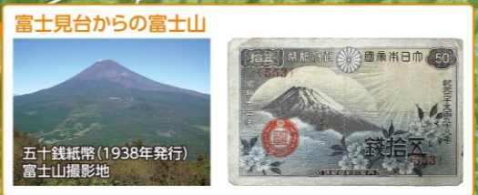
富士見台からの富士山 五十銭紙幣(1938年発行) 富士山撮影地