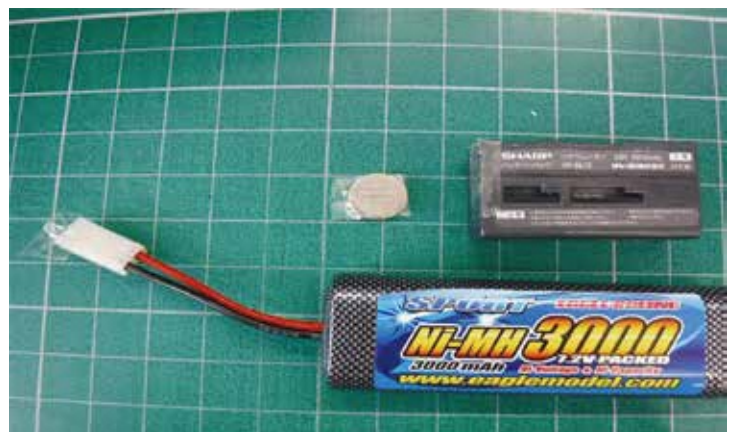
絶縁が必要な電池の例

ごみで出すときは、透明のセロハンテープで絶縁して、資源ごみの日の「電池類」で排出してください。