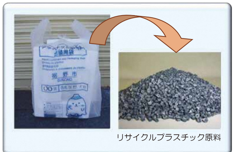
リサイクルプラスチック原料

プラスチック製容器包装の指定袋については、リサイクルの普及を図る観点から45リットルの大きい袋が販売されておりますので、きれいな発泡スチロールは、リサイクルしていただきますよう、ご協力をお願いします。