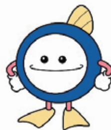
下水道マスコットキャラクター 「スイスイ」