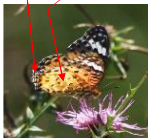
ツマグロヒョウモン♀

を棲（着物の端）に見立てて、その色が黒いことからツマグロヒョウモンって名前なんだ。