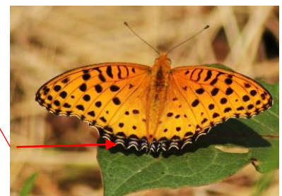
ツマグロヒョウモン♂