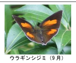
ウラギンシジミ (9月)