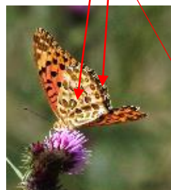
ツマグロヒョウモン♂