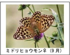
ミドリヒョウモン♀ (9月)

カッコ内は撮影月です。実際には春型や夏型があるように年に数回発生することがあります。また、標高によっても発生時期が異なる場合があります。