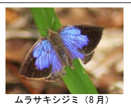
ムラサキシジミ (8月)