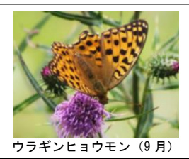
ウラギンヒョウモン (9月)