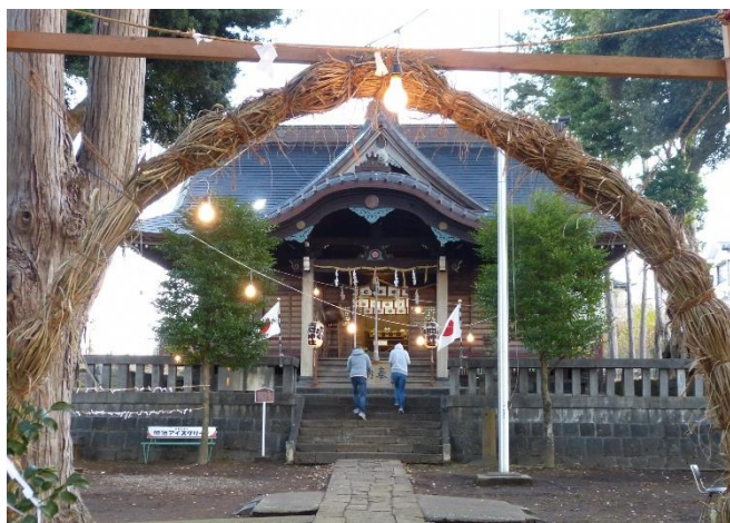
茅の輪のある元日の茶畑浅間神社

46段の石段を登ると正面に拝殿が見えます。拝殿は昭和5年の伊豆大地震を受けて建て直したもので、狛犬は地震からの復興を記念して制作されました。拝殿を回り込むと本殿が現れます。当社の本殿には覆殿（おおいでん）がなく、きれいに彩色された彫刻を見ることができます。また、拝殿の左手からは富士山をきれいに眺めることができ、富士山の神を祀る浅間神社にうってつけの場所と言えます。