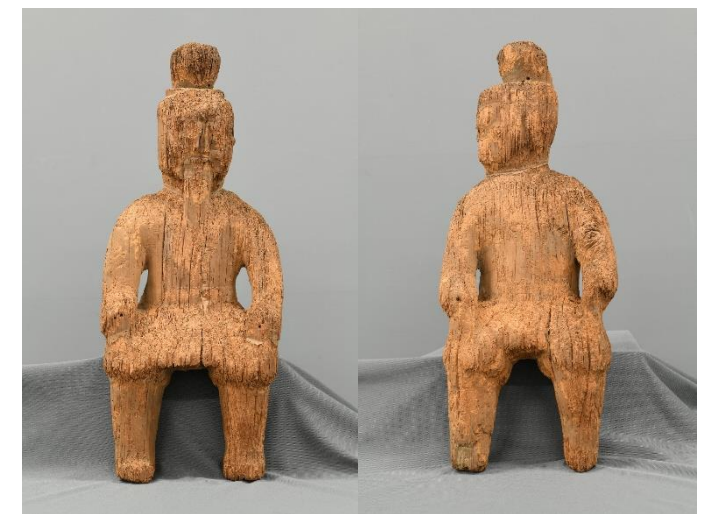
上原美術館

【編集・発行】裾野市文化財保護審議会・裾野市教育委員会生涯学習課 裾野市深良435番地 TEL055-994-0145 令和6年3月発行 当パンフレットは裾野市公式ウェブサイトでも公開しています