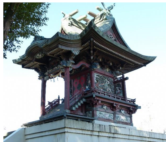
彫刻がすばらしい本殿は裾野日光とも呼ばれている

茶畑浅間神社の例大祭は10月15日で、子ども神輿や福引が行われています。また、8月25日の合社祭（※注2）では子ども相撲が奉納されます。神社は地区住民の共有地で、子どもたちの遊び場でもあります。かつては夏休み中に拝殿に泊まったこともあったそうです。