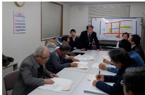
第3回区長連絡会の様子

平成31年3月12日(火)に平成30年度第3回区長連絡会を開催しました。今回の連絡会では、今年度の事業進捗状況の報告と、区長引き継ぎ事項についての説明をいたしました。ご出席くださいました区長の皆様、ありがとうございました。