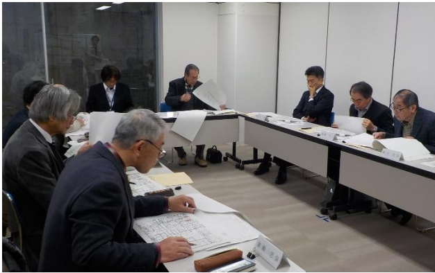
第41回土地地区画整理審議会の様子

また、事務局より土地評価基準の見直しについての報告および、平成30年度に実施した工事と今後の審議会のスケジュールについて説明を行いました。