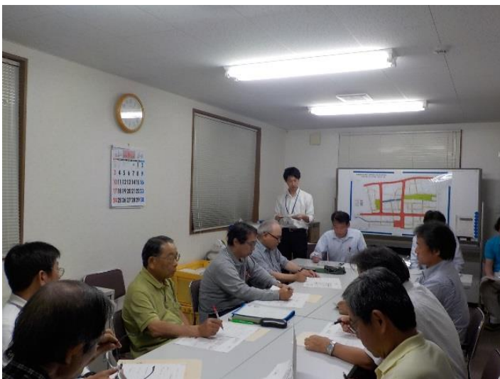
第1回区長連絡会の様子