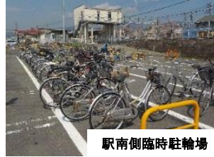
駅南側臨時駐輪場

駅西口の北側及び南側の2か所に臨時駐輪場を整備しました。平成29年9月より供用を開始しております。