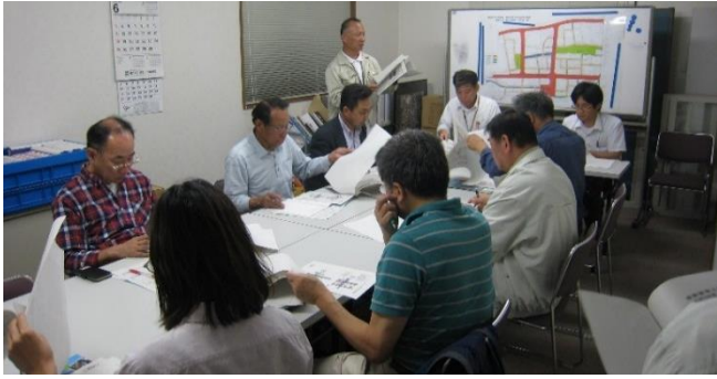
区長連絡会の様子