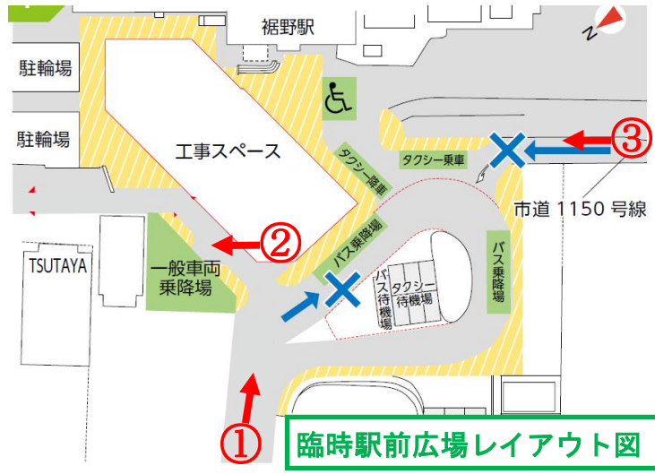
臨時駅前広場レイアウト図

切替えに伴い、歩行者等の安全性を高めるために、一般車両とバス・タクシーの利用区分を分けています。ご不便をおかけしますが、ご理解とご協力をお願いいたします。