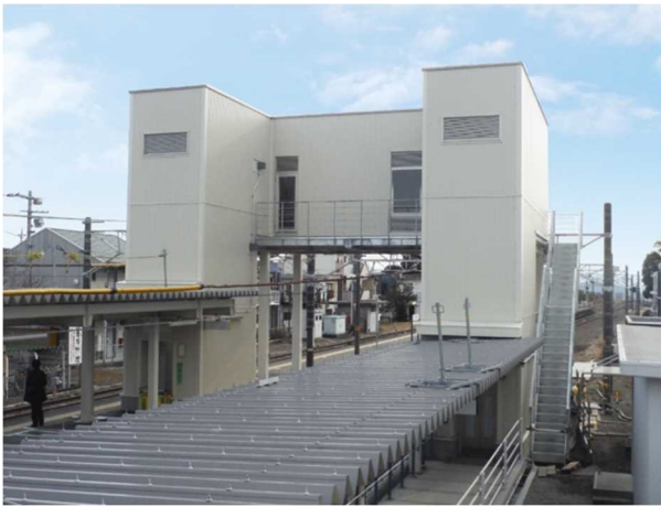
エレベーター、こ線橋の外観写真

2月25日の始発列車より裾野駅西口から上下線ホームへの移動にエレベーターをご利用いただけます。