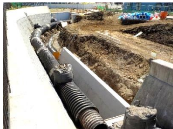
<令和 5 年度施工箇所>