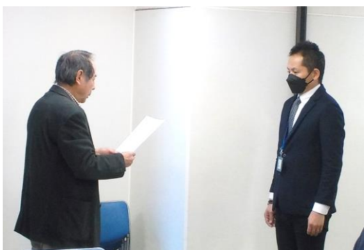
第26回仮換地指定の答申を受ける様子