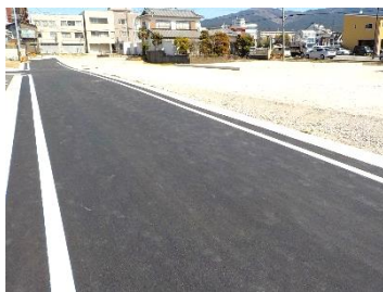
<6M-5 号線、22 街区の一部>