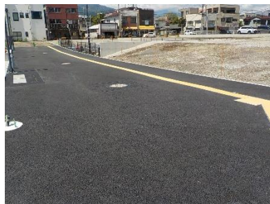
<電線共同溝設置箇所>