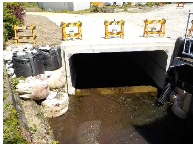
<令和 4 年度施工箇所>